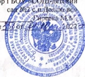
График проведения Школьного этапа всероссийской олимпиады школьников в ГБОУ «СОШ-детский сад №2 с.п.Долаково» 2022-2023 учебном году: